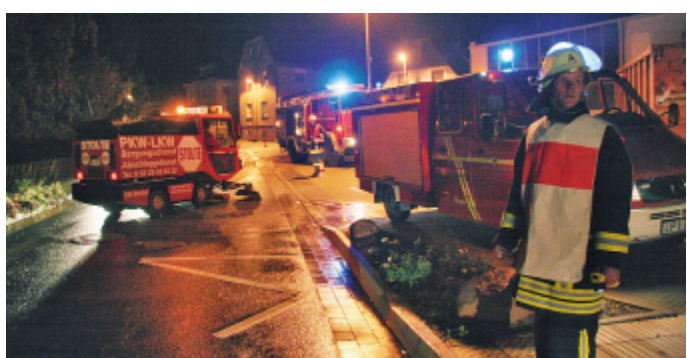
Ölunfall: Die Feuerwehr holte die Kehrmaschine eines Unternehmens nach Heiden zur Hilfe.

Zwar habe das Öl den Oetternbach erreicht, aber die Gefahr sei gebannt, sagte Hirt. Mitarbeiter des Lagenser Bauhofes saugten Pflützen von der Straße, auch der Abwasserkanal wurde kontrolliert. Bis dorthin sei der Treibstoff aber nicht vorgedrungen, so Hirt. Auch das Umweltamt des Kreises war am Ort des Geschehens im Einsatz. (te)